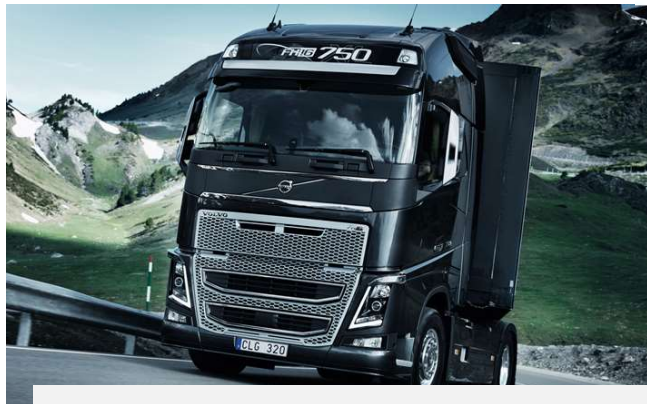
Brems- und Schaltelektronik für LKW