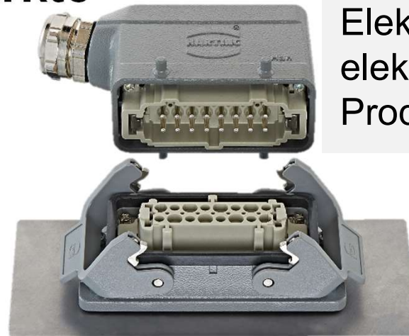
Elektrische und elektronische Produkte